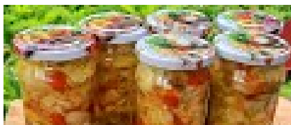
SALAATKA Z OGÓRKÓW I PAPRYKI NA ZIM...