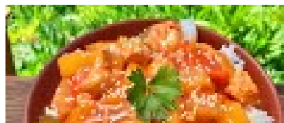
KURCZAK W SOSIE SŁODKO KWAŚNYM -SZY...