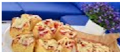
SZYBKIE CIASTO JOGURTOWE Z TRUSKAWK...